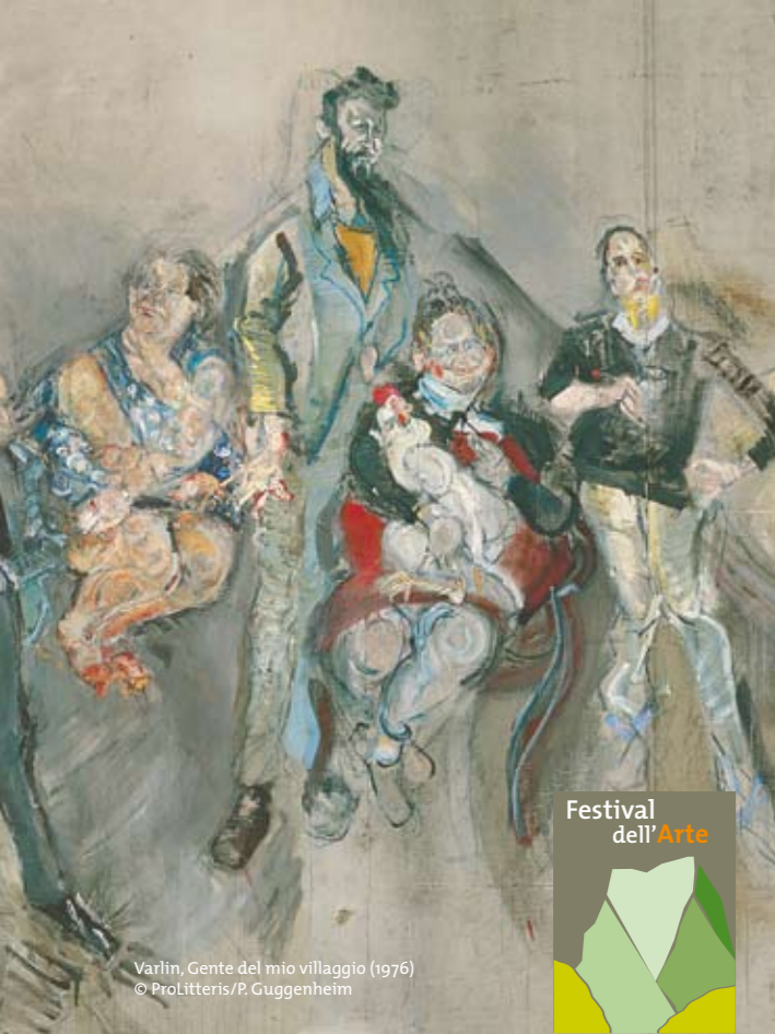
Varlin, Gente del mio villaggio (1976)